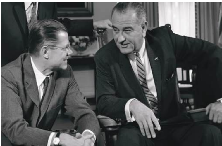
Мудофаа вазири Роберт Макнамара ҳамда Президент Линдон Жонсон. Кеннедининг ўлимидан сўнг улар Вьетнамга уруш очишганди.