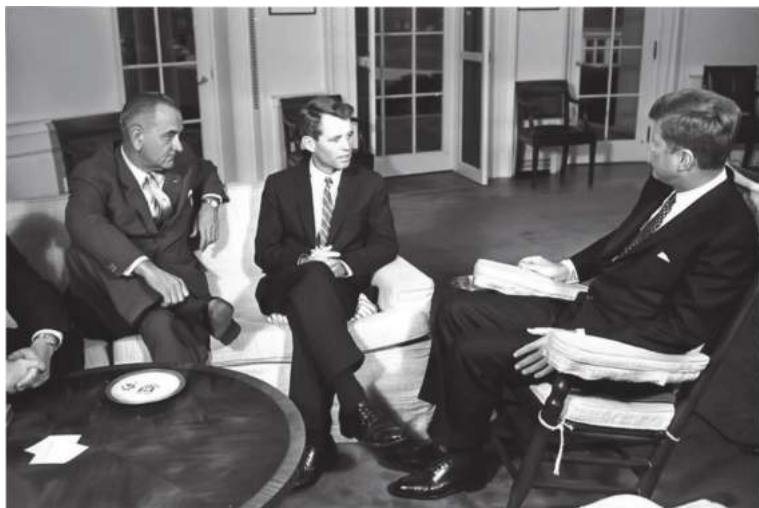
Вице-президент Линдон Жонсон ҳамда Бош прокурор Роберт Кеннеди – президентнинг асосий маслаҳатчилари.