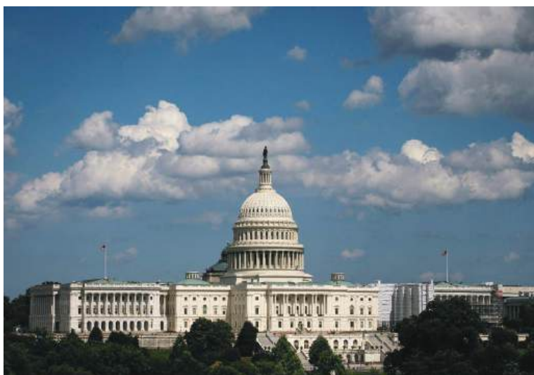
Конгресс (Капитолий биноси)