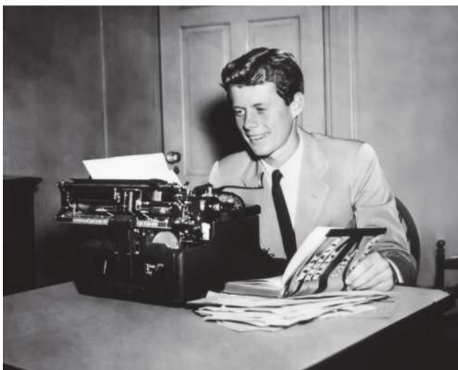
Жон Кеннеди АҚШ президентлари ичида журналистика соҳасидаги энг нуфузли соврин Пулитцер мукофотига сазовор бўлган ягона президент.