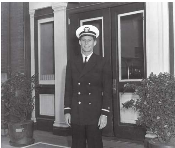
Уруш қаҳрамони Жек Кеннеди