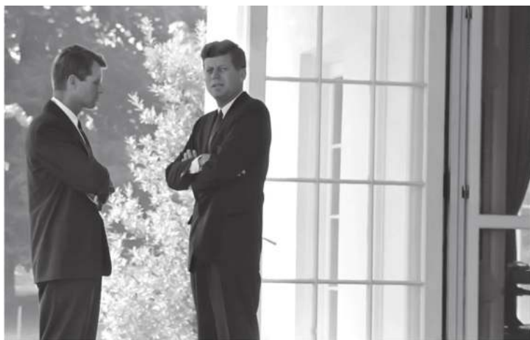
Кариб инқирозига ечим излаб ака-ука Кеннедилар машҳур Барбара Такмэннинг “Август замбараклари” асарига юзланадилар.