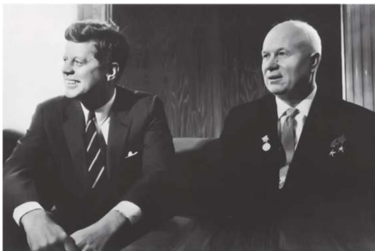
Жон Кеннеди ҳамда Совет давлати раҳбари Никита Хруишчёв