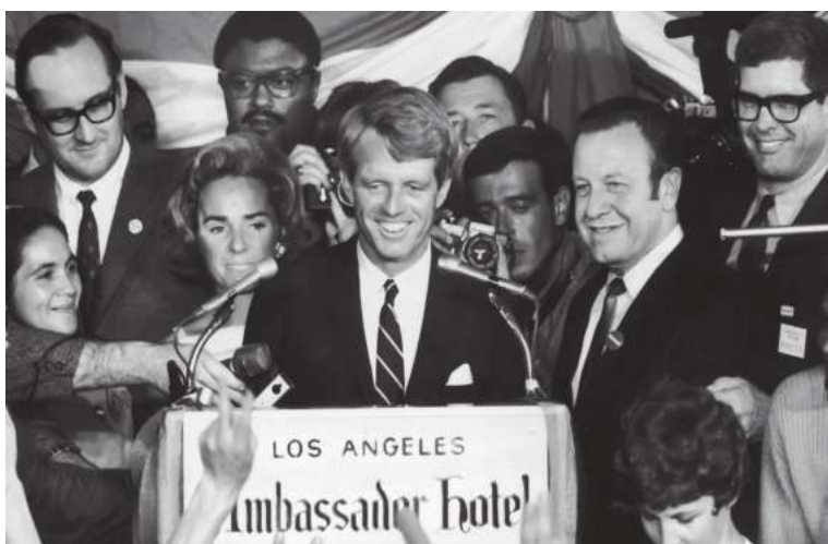
Лос Анжелес, "Ambassador" отели. Роберт Кеннедининг сўнги дақиқалари... У ғалабага жуда яқин эди...