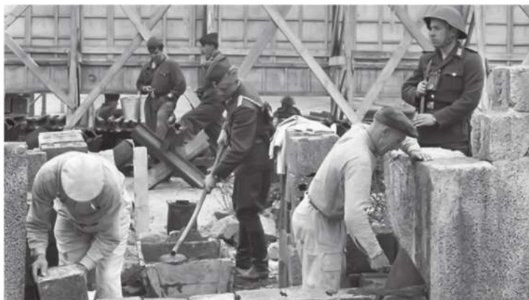
1961 йил Берлин девори қурилиши