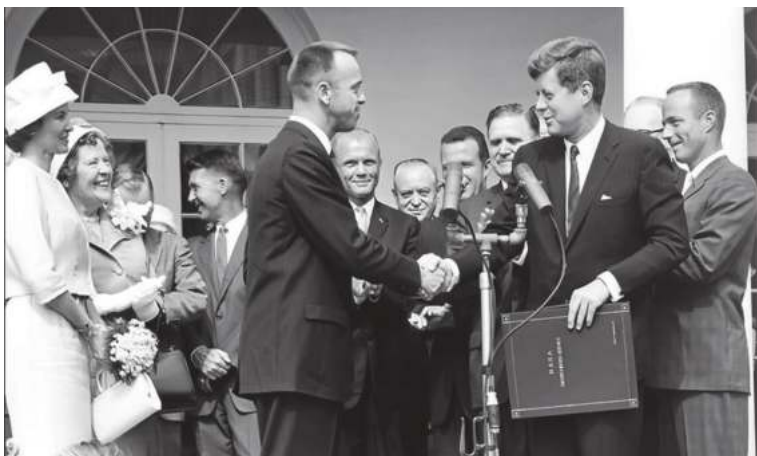
Америкаликлардан биринчи бўлиб фазога парвоз қилган астронавт Аллан Шепард мамлакат Президенти томонидан тақдирланмоқда