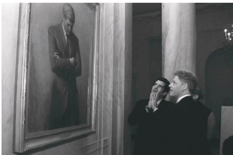
Клинтон ва Кеннедининг ўғли Оқ уйда марҳум президент қаршисида