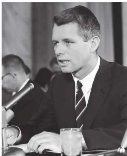
АҚШ собиқ Бош прокурори Роберт (Бобби) Кеннеди