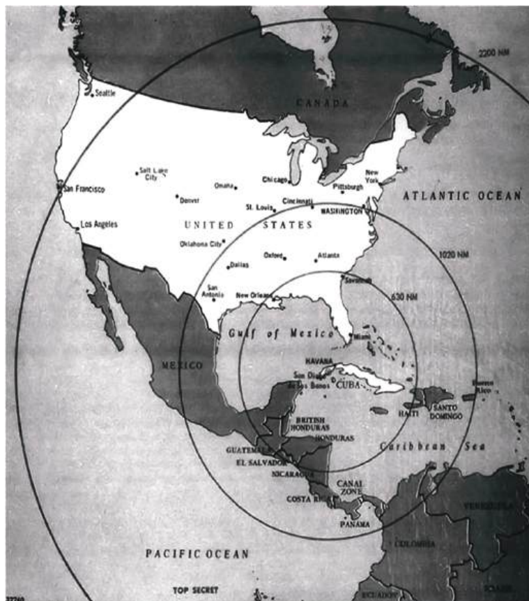
“Анадирь” операцияси бўйича Кубада жойлаштирилган ракеталар радиуси.