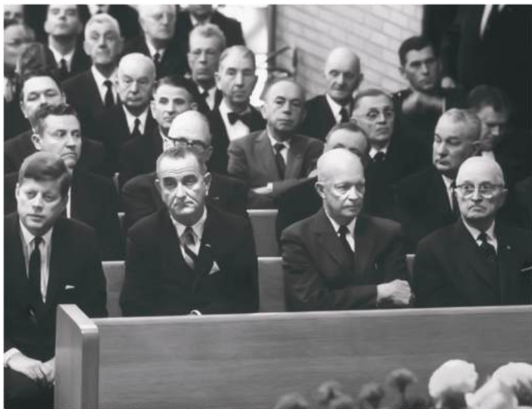
Жон Кеннеди, Линдон Жонсон, Дуайт Эйзенхауэр ва Гарри Трумэн – АҚШнинг 35, 36, 34 ва 33-президентлари.