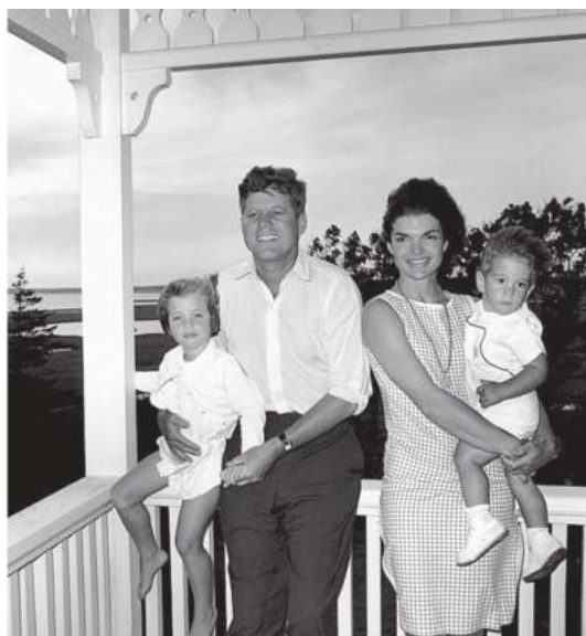
Жон Кеннеди, рафиқаси Жаклин ва фарзандлари Кэролайн ҳамда Жон.