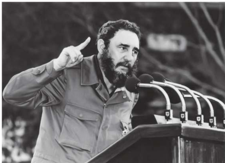
Куба раҳбари Фидель Кастро