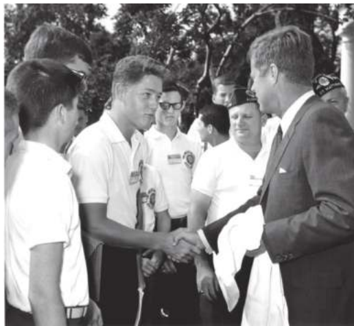
Жон Кеннеди ҳамда АҚШнинг 42-президенти Билл Клинтон. 1963 йил 24 июлда ёш Билл Оқ уйга таши- риф буюради ва Президент билан учрашади. Айтишларича, Кеннеди ўшанда бўлгуси президент Клинтонга унинг ҳам президент бўлиш орзуси бор- лигини билиб, унга сайловларда омад тилаган экан.