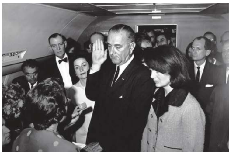
Линдон Жонсон Техас аэропортида қасамёд қабул қилиб президентлик лавозимига киришмоқда. Унинг ёнида аёли Леди Бёрд Жонсон ҳамда бева Жаклин Кеннеди.