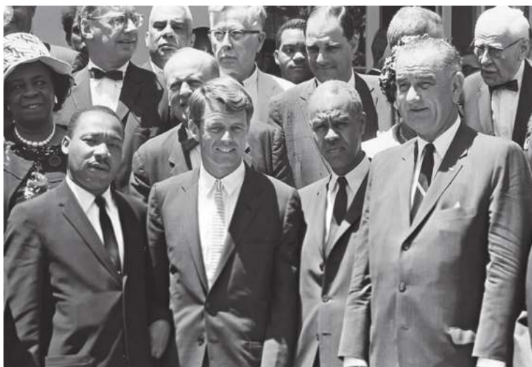
Мартин Лютер Кинг, Роберт Кеннеди ҳамда Линдон Жонсон