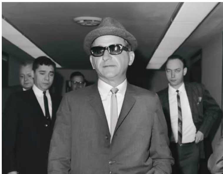
Америка мафия “оталари”дан бири Сэм Жанкана