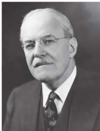
Марказий Разведка Агентлигининг собиқ раҳбари Аллен Даллес