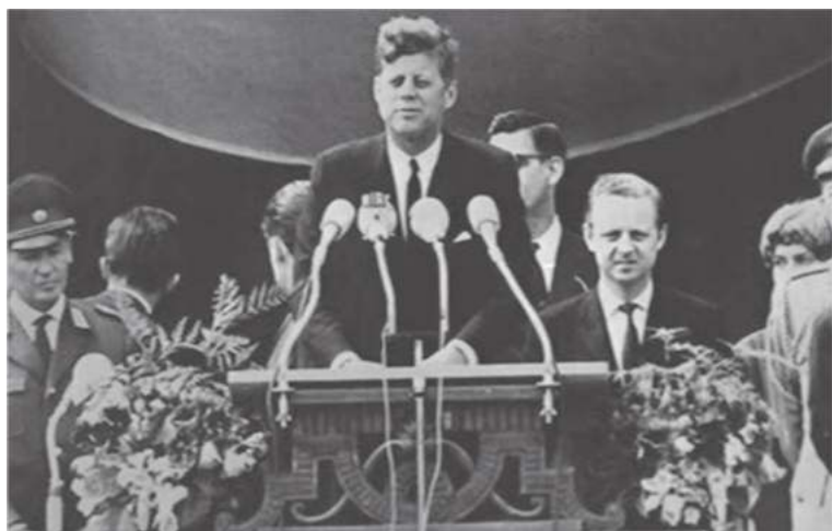
1963 йил 26 июнь Ғарбий Берлин. “Ich bin ein Berliner!”