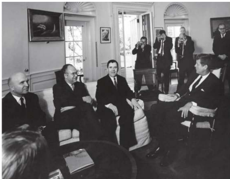
1962 йил октябрь. Президент Кеннеди ҳамда СССР Ташқи ишлар вазири А.Громико.