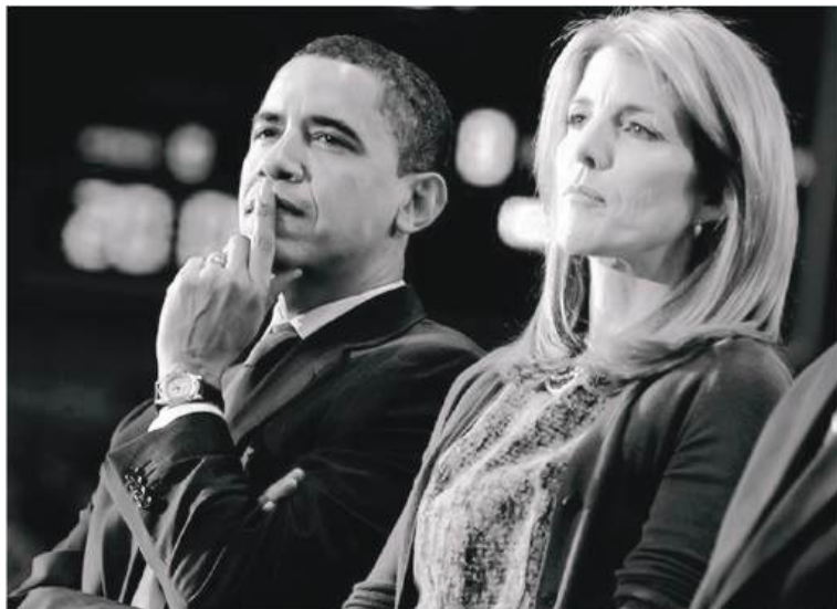
АҚШ 44-Президенти Барак Обама ҳамда унинг Япониядаги элчиси Кэролайн Кеннеди (Жон Кеннедининг қизлари)