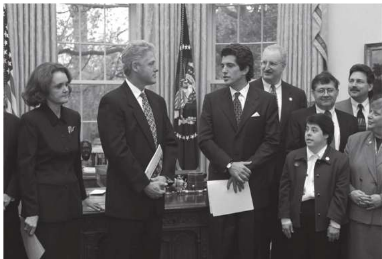
Президент Билл Клинтон ҳамда Жон Кеннедининг ўғли