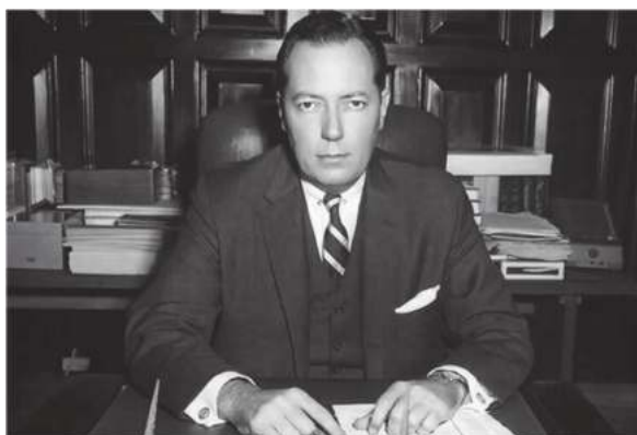
Нью-Орлеанс округ прокурори Жим Гаррисон

Кеннедининг ўлими Америка жамоатчилиги ҳамда бутун Ғарб олами учун трагедия эди. Унинг жанозасига бутун дунёдан юздан ортиқ президентлар, қироллар, давлат ва ҳукумат раҳбарлари ташириф буюрадилар.