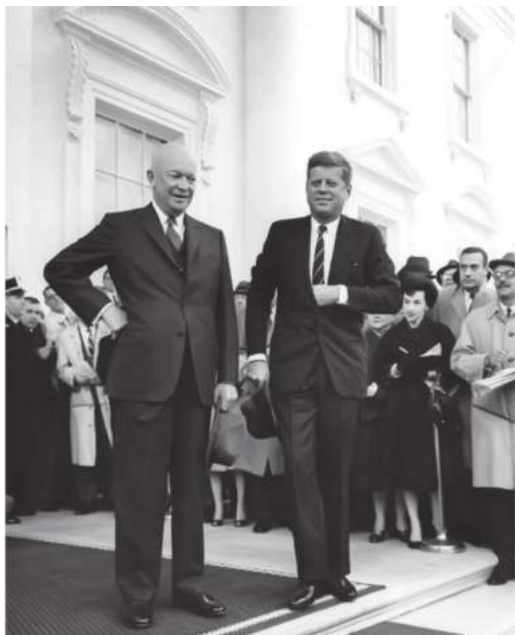
Лавозимини тарк этайтган Президент Дуайт Эйзенхауэр ҳамда янги сайланган Жек Кеннеди.