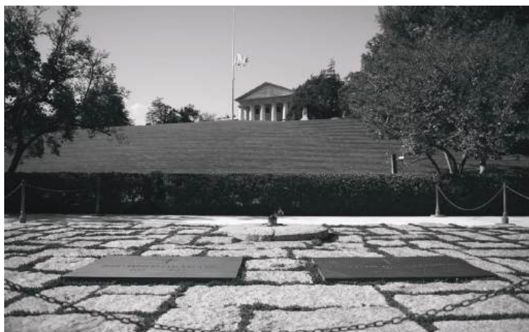
Арлингтон Миллий қабристони (Вашингтон). Ака-ука Кеннедиларнинг қабри ва улар шарафига ўрнатилган мангу олов.