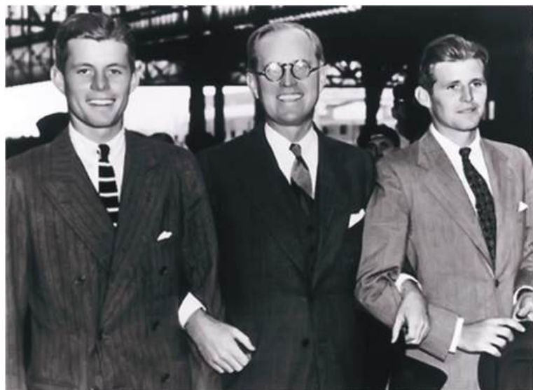
Жозеф Кеннеди ўғиллари Жо ва Жек билан