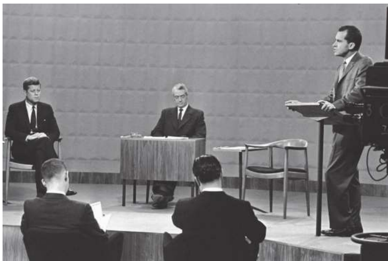
1960 йилги президентлик теледебатлари. Кеннеди ва Никсон ўртасидаги дебатлар жаҳон теледебатлариغا асос солган.