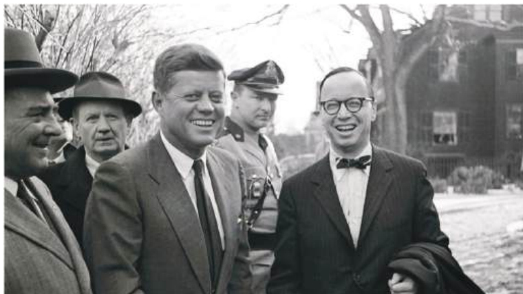
Жон Кеннеди ва тарихчи Артур Шлезингер (Кеннедилар ҳақида ёзилган машҳур “A thousand days: John F. Kennedy in the White House” ҳамда “Robert Kennedy and His Times” асарлари муаллифи)