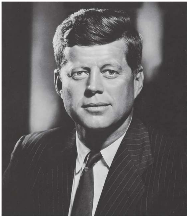
ПРЕЗИДЕНТ ЖОН ФИЦЖЕРАЛЬД КЕННЕДИ (1917-1963)