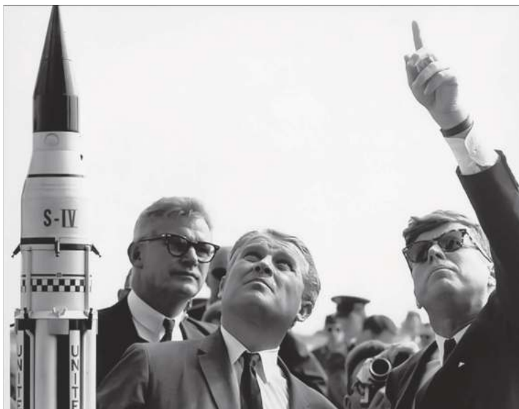
Жаҳон космонавтикаси отаси Вернер фон Браун лойиҳаларни Президентга тақдим этмоқда