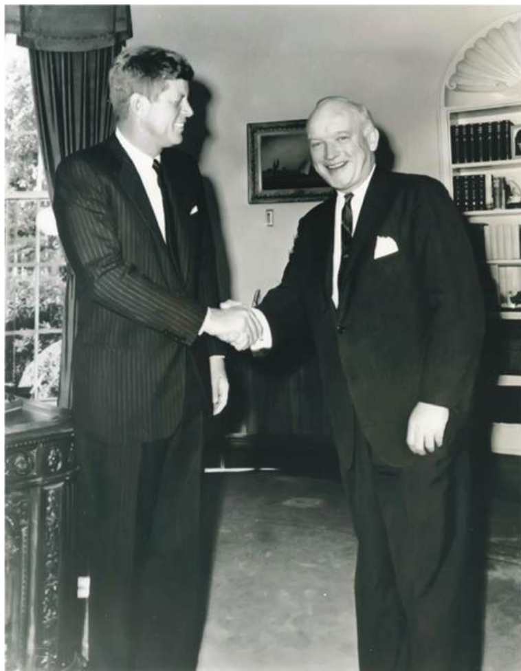
Маҳоратли музокарачи Жеймс Донован Президент Кеннеди қабулида.