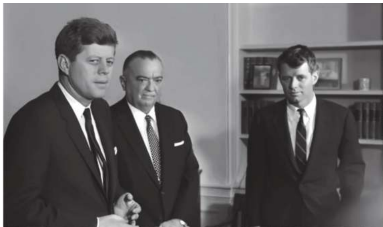
ФҚБ асосчиси Эдгар Гувер ака-ука Кеннедилар қабулида